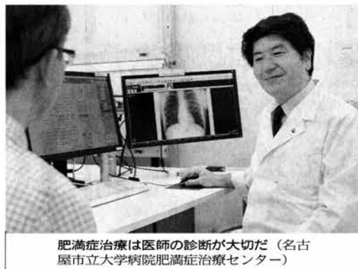
肥満症治療は医師の診断が大切だ（名古屋市立大学病院肥満症治療センター）